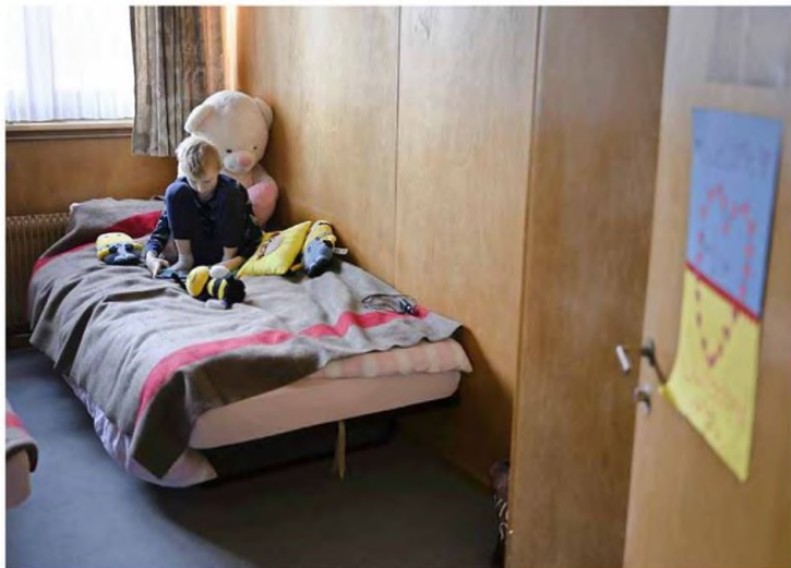
Plus de 2100 Ukrainiens fuyant la guerre sont déjà arrivés en Suisse. Des dizaines de milliers pourraient suivre, estime le Conseil fédéral.

RÉFUGIÉS L'arrivée d'Ukrainiens fuyant l'invasion russe est facilitée dès ce samedi. Le Conseil fédéral leur accorde le statut de protection «S», qui est valable un an (renouvelable), permet de travailler et de faire venir sa famille. Certains ressortissants d'autres pays qui ont dû fuir l'Ukraine pourront aussi en bénéficier. Par ailleurs, en Ukraine, les forces russes augmentaient hier la pression sur Kiev et l'est de l'Ukraine, où la grande ville de Dnipro a à son tour été prise pour cible. Le conflit suscite des vocations chez les combattants étrangers, côté ukrainien comme russe, poussés par des motivations variées. ➤ 4/5/6