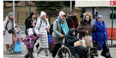
Wer wegen des Krieges in der Ukraine in die Schweiz flüchtet, erhält den Schutzstatus S und kann ohne Asylverfahren im Land bleiben.

Ukraine – Menschen, die wegen des Krieges aus der Ukraine geflüchtet sind, erhalten in der Schweiz den Schutzstatus S. Das heisst, dass sie ohne Asylverfahren vorerst ein Jahr in der Schweiz bleiben, arbeiten und zur Schule gehen können.